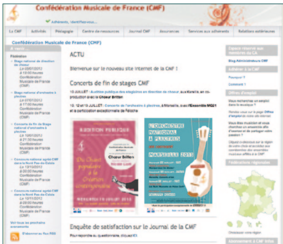
Le site CMF, vu par tous