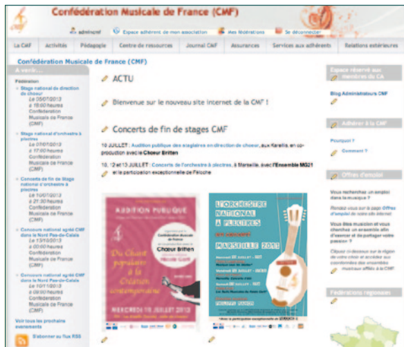
Le site CMF, lorsque l'administrateur est connecté