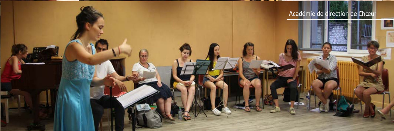
Académie de direction de Chœur