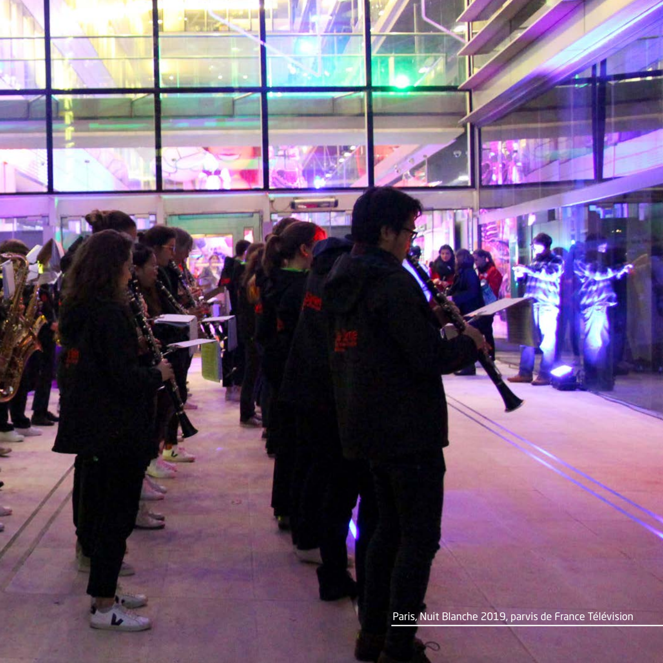
Paris, Nuit Blanche 2019, parvis de France Télévision