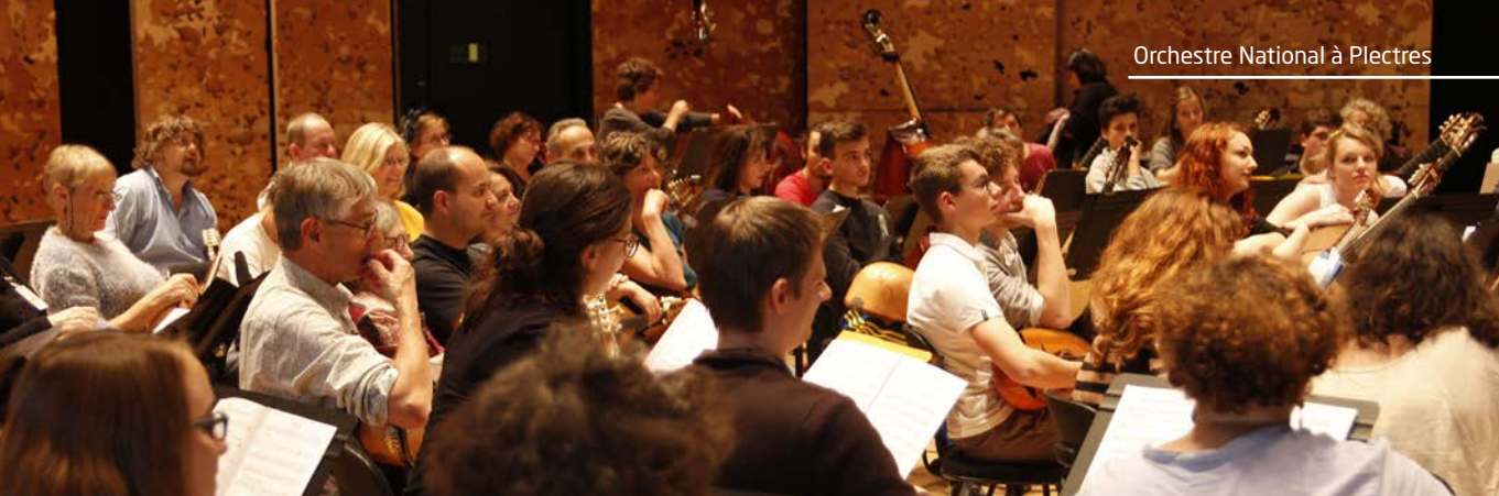
Orchestre National à Plectres