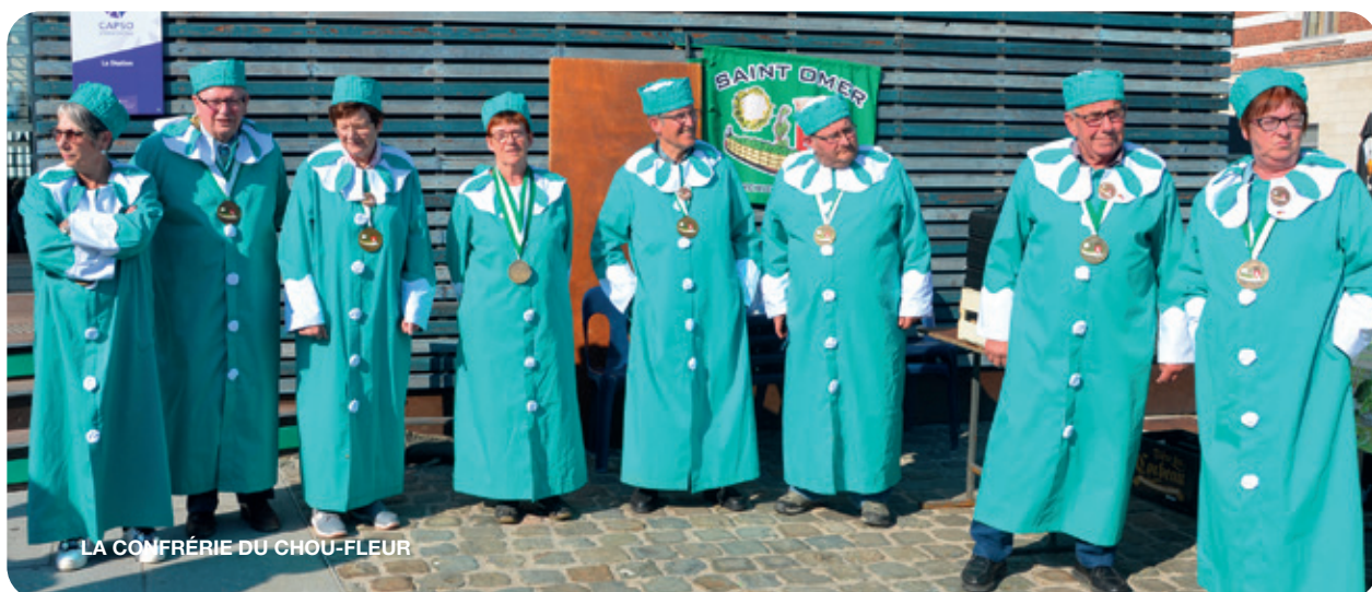
LA CONFRÉRIE DU CHOU-FLEUR