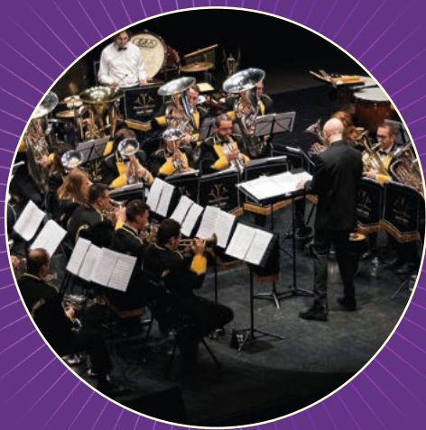
Hauts-de-France Brass Band