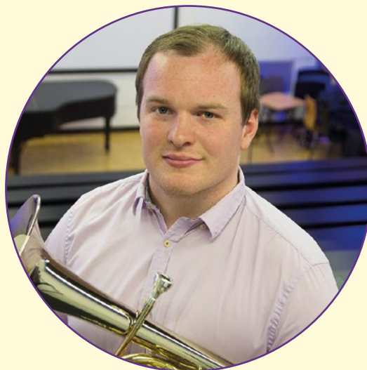
Jonathan Bates © DR