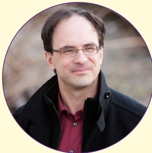
Olivier Waespi