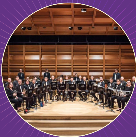
Paris Brass Band