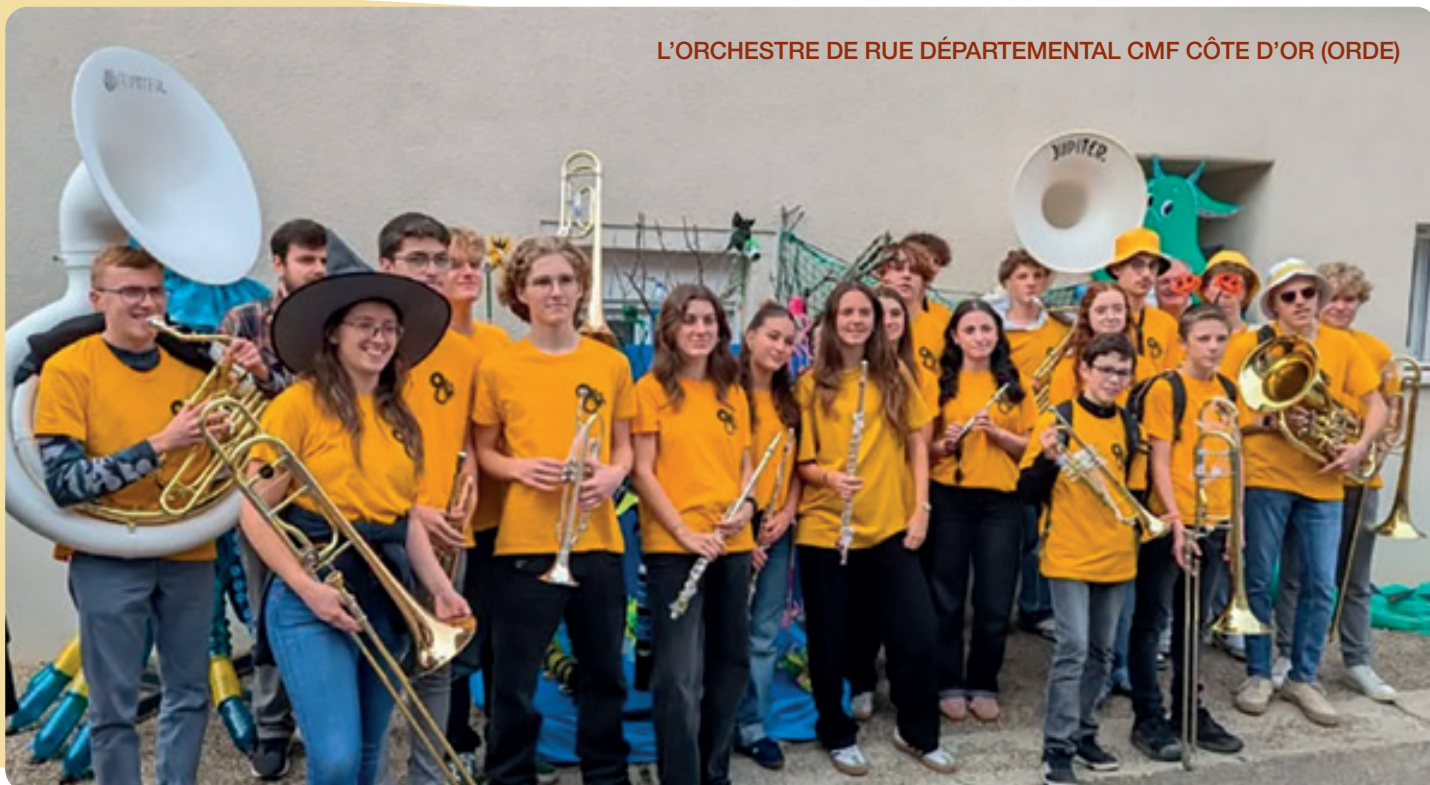
L'ORCHESTRE DE RUE DÉPARTEMENTAL CMF CÔTE D'OR (ORDE)