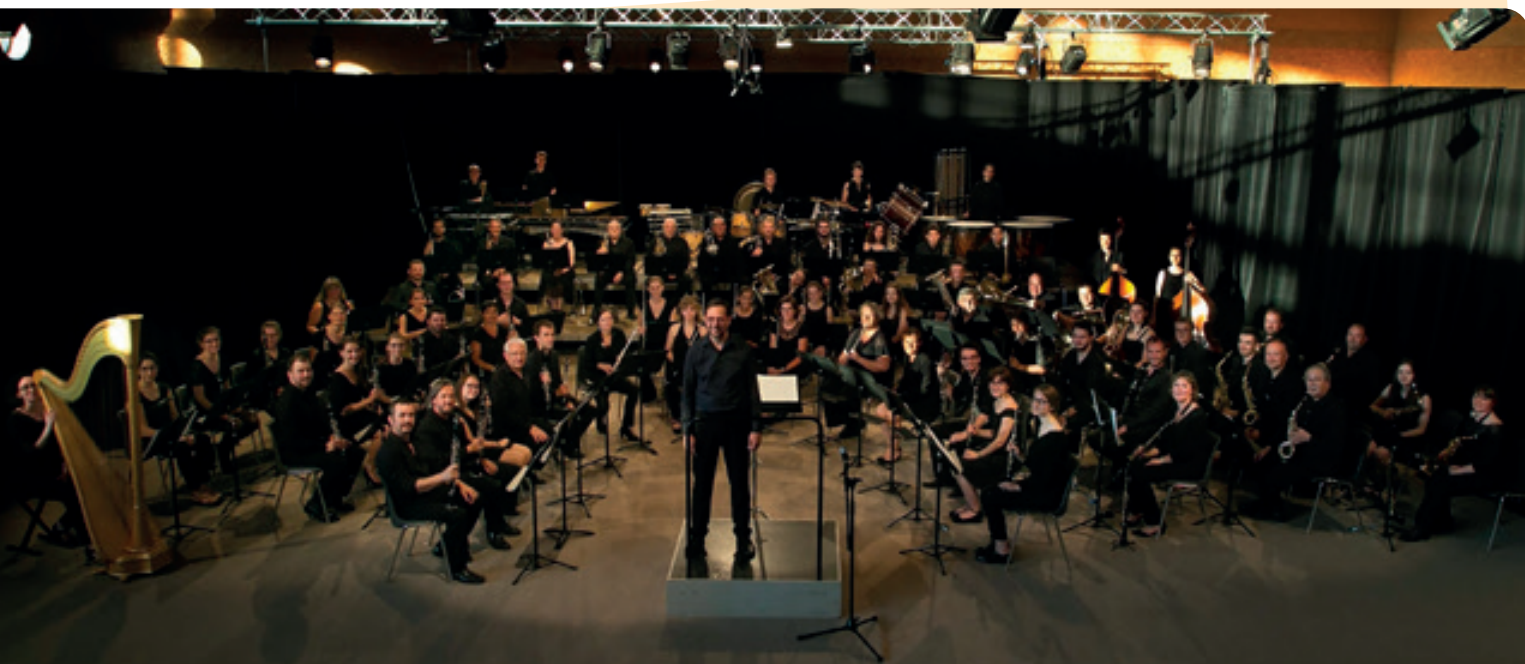
L'ORCHESTRE D'HARMONIE DE LA VILLE DE TONNERRE

Il a reçu le prix de l'Académie française pour l'essor des ensembles à vent (2010) et a été sélectionné pour un championnat à la Philharmonie de Paris en 2023. En 2024, il s'est associé au chœur « Les Métaboles » pour un projet porté par la Cité de la Voix.