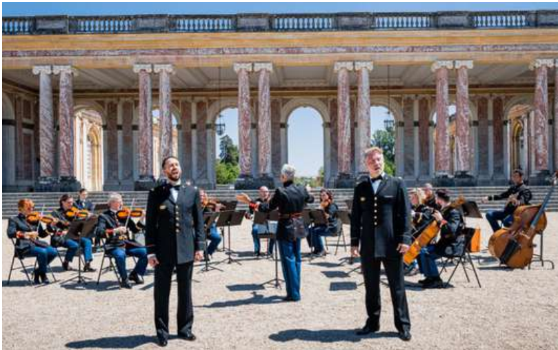
Grand Trianon de Versailles