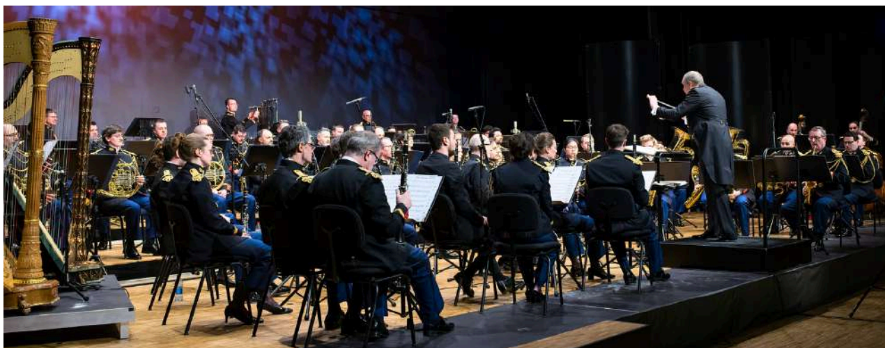
Orchestre d'harmonie de la Garde républicaine, saison musicale d'Artikuss Sanem, Luxembourg

Les musiciens interviennent lors de cérémonies officielles et dîners d'État. En parallèle, l'Orchestre se produit sur tout le territoire français et à l'international. Il est ainsi à l'affiche de saisons musicales (Invalides, Théâtre des Champs-Élysées, Opéra National de Bordeaux...), de festivals (Berlioz, Saintes, Rocamadour...) et de concours internationaux (Long-Thibaud, Maurice André, Adolphe Sax...).