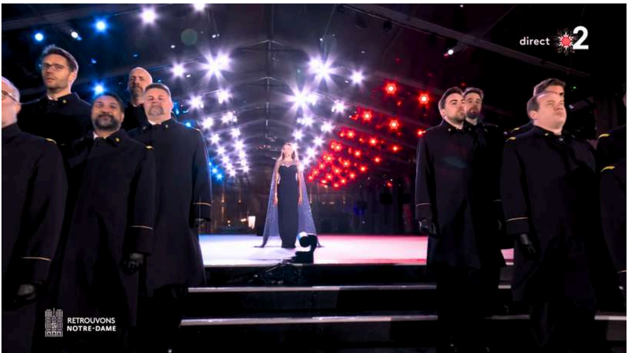
Chœur de l'Armée française et Nadine Sierra © France télévisions - Réouverture de Notre-Dame de Paris

Fort de plusieurs enregistrements, salués par la critique, le Chœur de l'Armée française a reçu le Classique d'or RTL dès la sortie de son album Paris, je t'aime , enregistré sous le label Warner Classics.