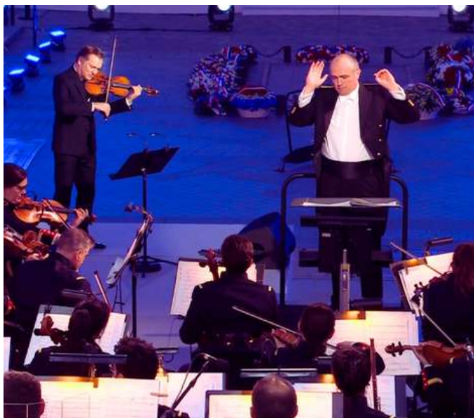
Orchestre symphonique de la Garde républicaine et Renaud Capuçon

© France télévisions - Le concert de la paix