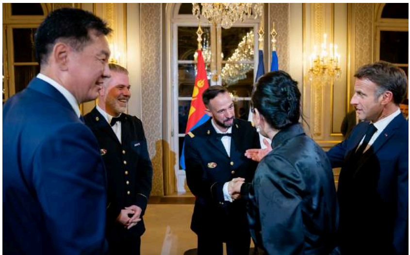
Palais de l'Élysée

En parallèle, ils participent à des Saisons musicales et des festivals, sur tout le territoire français et à l'international.