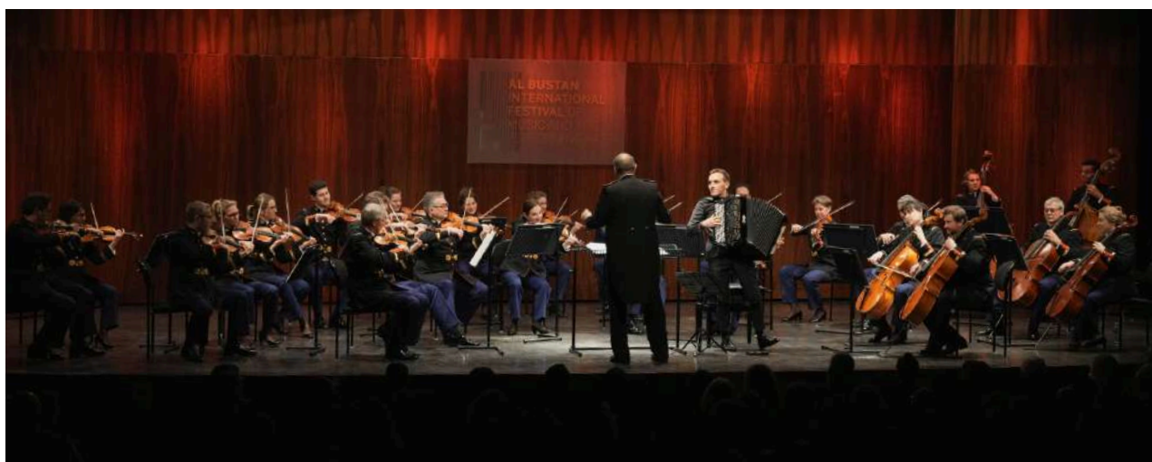
Orchestre à cordes de la Garde républicaine et Félicien Brut Beit Mery, Liban

Membre de l'Association Française des Orchestres (AFO), l'Orchestre se développe au sein de projets variés et ambitieux.