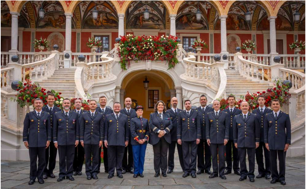
Cour d'Honneur du Palais Princier, Monaco