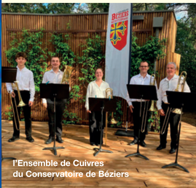
l'Ensemble de Cuivres du Conservatoire de Béziers